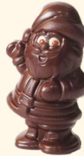
▲ Père Noël HOHOHO

Hauteur 8 cm - 40 g Conditionné en sachet Noir - Réf. 9331253 Lait - Réf. 9331254