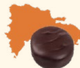
Saint Domingue Légèrement fruité