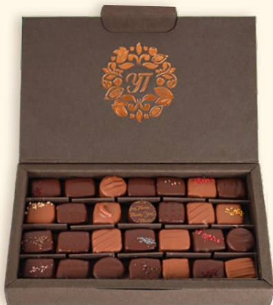
▲ Coffret éco-responsable 280 g (28 pièces) Réf. 9611500