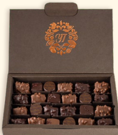
▲ Coffret éco-responsable bonbons et mini-rochers - 260 g Réf. 9611501