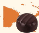
Papouasie Corsé et boisé