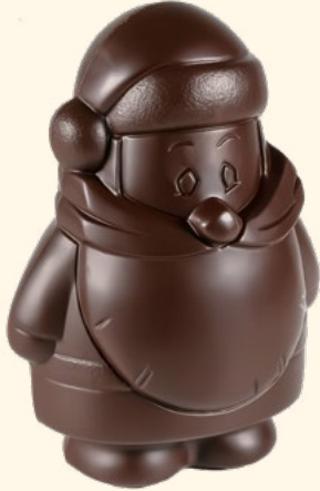
▲ Père Noël

Hauteur 17 cm - 230 g Conditionné en boîte plexi Noir - Réf. 9331297 Lait - Réf. 9331298