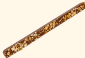
Bâtonnet lait éclats de crêpe dentelle