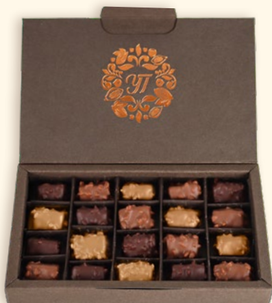
▲ Coffret éco-responsable 20 mini-rochers - 230 g Noir, lait, blanc caramélisé Réf.0020258-[9181080]