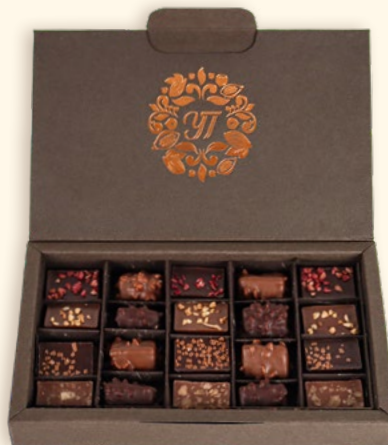
▲ Coffret éco-responsable mini-rochers et palets fourrés - 250 g Réf. 9611502