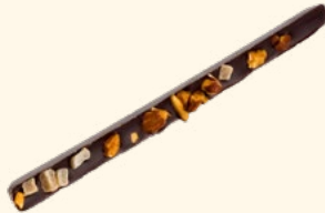
Bâtonnet noir amande orange Pépites d'oranges, éclats d'amandes caramélisées