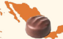
Mexique Epicé et boisé