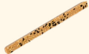
Bâtonnet blanc caramélisé sésame Sésames grillés, sel noir